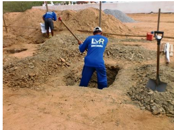
Construtora inicia serviços da futura Unidade Básica de Saúde

O ano de 2014 começou com muito trabalho para a Administração Pública Municipal. A Secretaria de Obras Públicas e Serviços Urbanos iniciaram a construção de uma unidade básica de saúde – UBS, localizada na zona urbana do município.