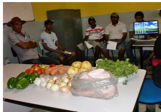
Agricultores do município apresentam produtos da AF

Cumprindo determinação de Resolução do FNDE o município de Caraúbas realizou no mês de Janeiro do corrente a Chamada Pública n.º 001/2014, para aquisição de gêneros alimentícios da Agricultura Familiar.